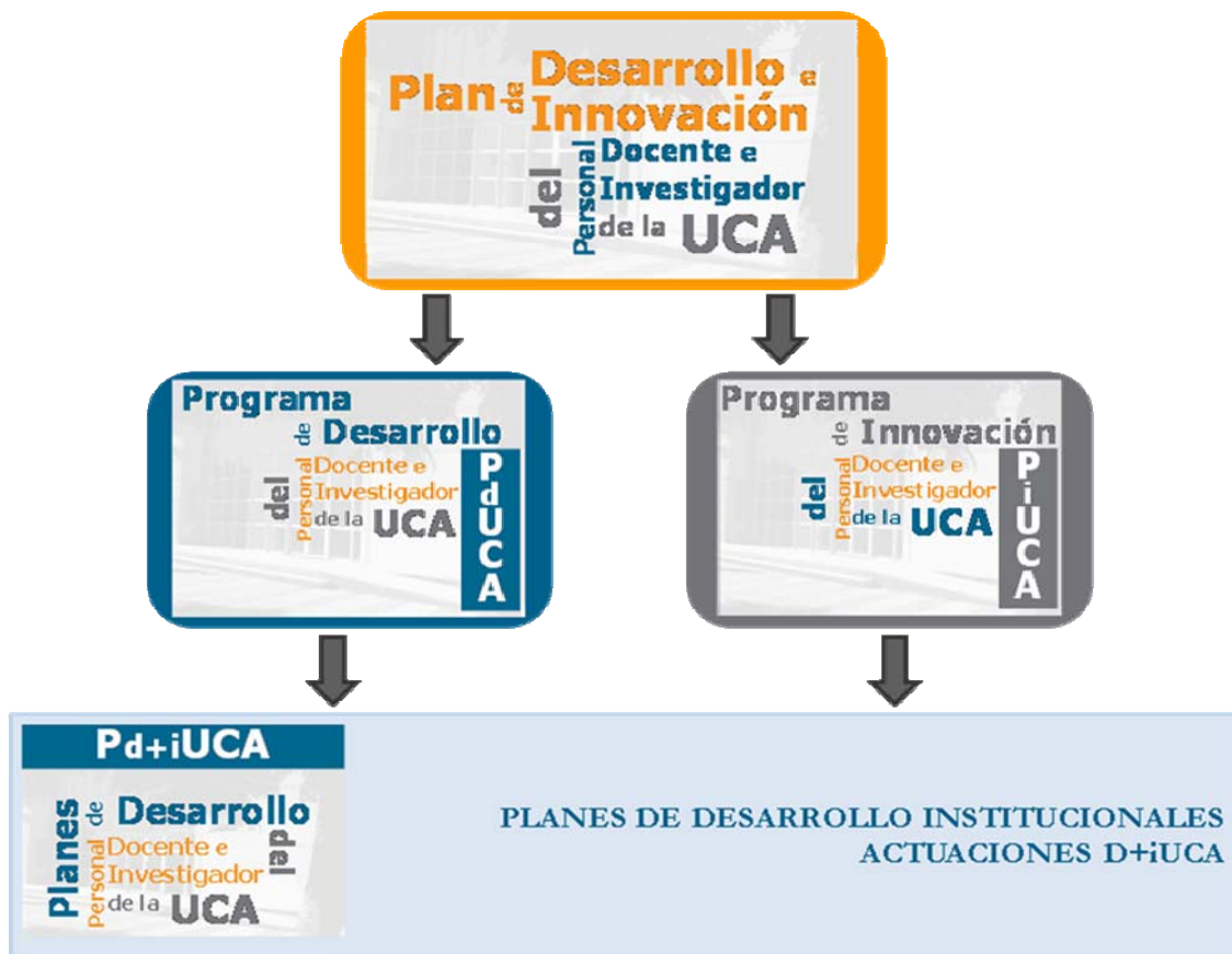
Figura 1: Estructura del Plan de Desarrollo e Innovación

Con el fin de mejorar la calidad de la actividad docente e incrementar las competencias y perfeccionamiento del personal docente e investigador de la Universidad de Cádiz, desde el Vicerrectorado de Tecnologías de la Información e Innovación Docente se está desplegando el Plan de Desarrollo del Personal Docente e Investigador (Pd+iUCA). En la figura 1 se representa la estructura de dicho plan que reúne el Programa de Desarrollo del Personal Docente e Investigador (PdUCA) y el Programa de Innovación Educativa (PiUCA). Ambos programas se concretan en diversas convocatorias anuales.